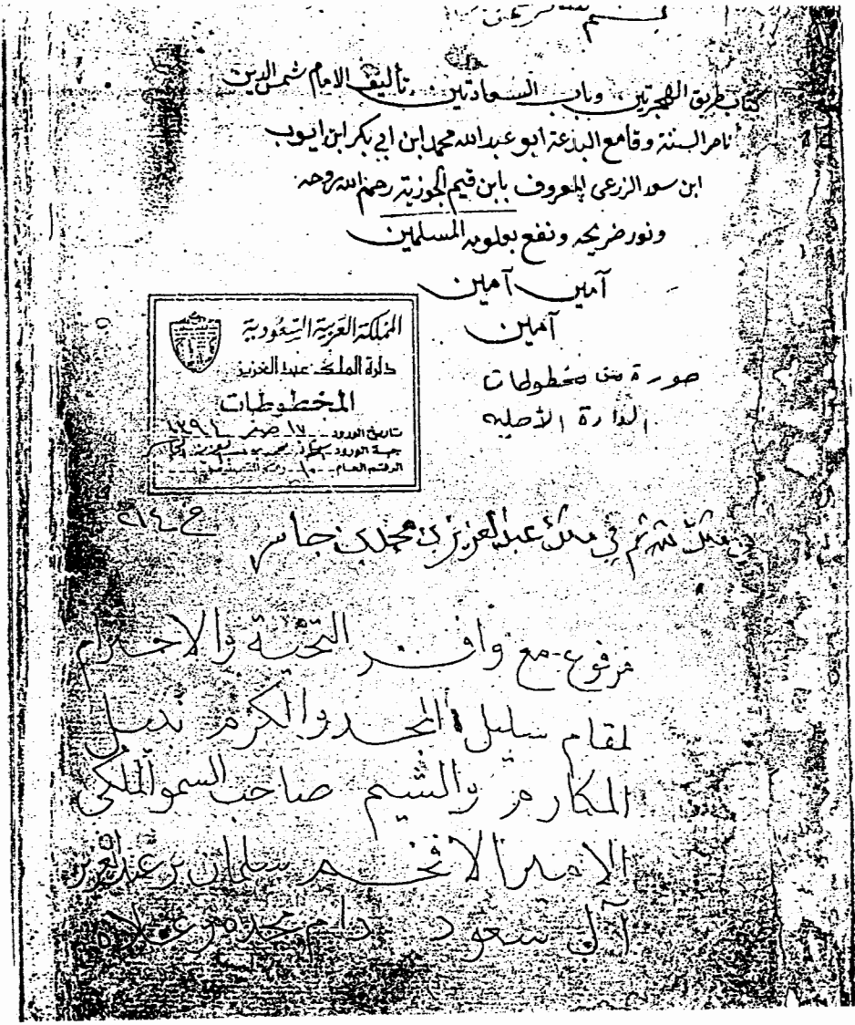
الصفحة الأولى من مخطوطة كتاب الهجرتين و باب السعادتين